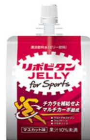
リポビタンゼリー for Sports 清涼飲料水(ゼリー飲料)