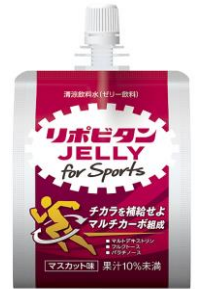
リポビタンゼリー for Sports