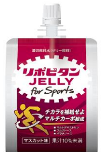
リポビタンゼリー for Sports 清涼飲料水(ゼリー飲料)